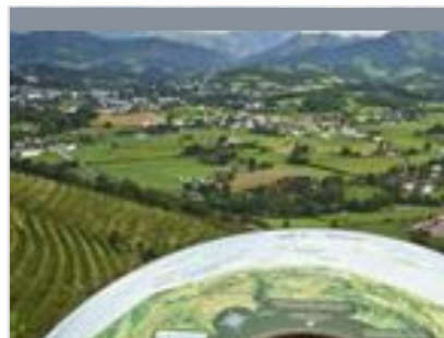
Table d'orientation Itarako d'Ascarat

Massif mi-boisé, mi-rocailloux qui sépare la Soule de la Basse-Navarre, les Arbailles s'étendent sur une superficie de 165km 2 . Creusé de fosses profondes, parsemé de vallons suspendus et de sommets pointus, ce site karstique revêt un caractère mystique et étrange, source de nombreuses légendes. Les amateurs de flore seront enchantés par la diversité des espèces végétales et les panoramas, tandis que les vestiges historiques disséminés le long du chemin évoquent les traditions ancestrales de la région. La randonnée d'Ahusquy, balisée et accessible depuis l'auberge, est une invitation à découvrir les secrets les mieux gardés de cette forêt majestueuse. Il s'agit d'un espace naturel encore largement sauvage où la pratique hors sentier peut se révéler dangereuse à cause de nombreux gouffres.